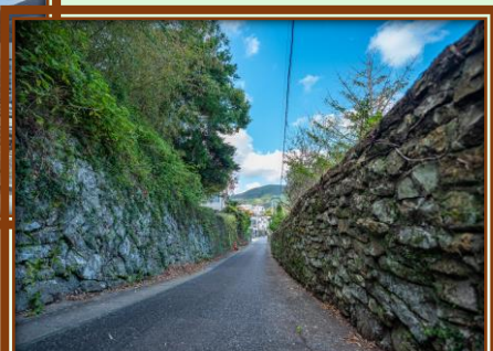
城下町の風情の残る巖原の石壁