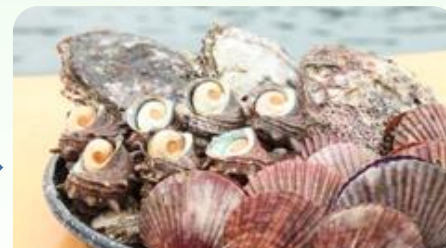
2日目夕食/海鮮バーベキュー(一例)