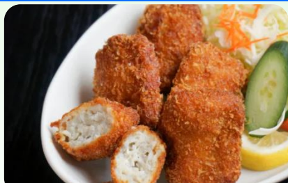
2日目昼食/そう介メンチカツ(一例)